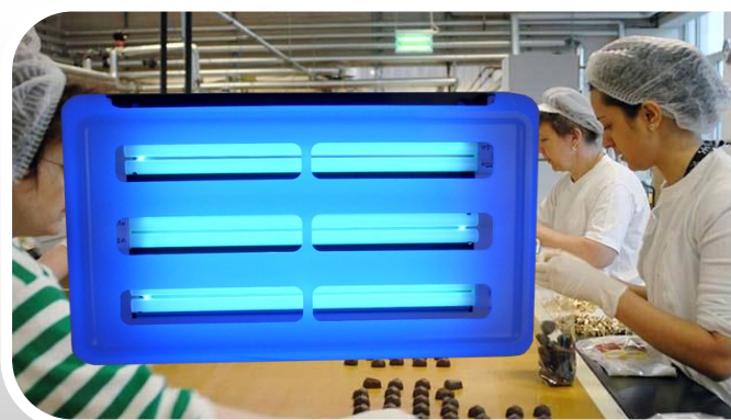
T22 (36W Lámparas Ultravioletas x 3)

Conforme regulación FDA con tecnología ULTRA BRIGHT™